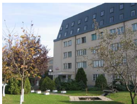
Școala tehnică, Fundația Româno-Germană din Timșoara, era o clădire obișnuită cu acoperiș plat. Astăzi, în urma procesului de mansardare, clădirea a căpătat o personalitate aparte.

În timp ce aspectul exterior al școlii este unul de efect prin asimetria care îl definește, ideea care determină interiorul clădirii a fost crearea de încăperi bine iluminate, ventilate corespunzător și cu un aspect echilibrat. În acest scop, majoritatea încăperilor au surse de lumină naturală pe ambele laturi ale acoperișului pentru ca întreaga cameră să poată beneficia de un aport corespunzător de lumină. Aceleași ferestre asigură și cantitatea de aer curat necesar.